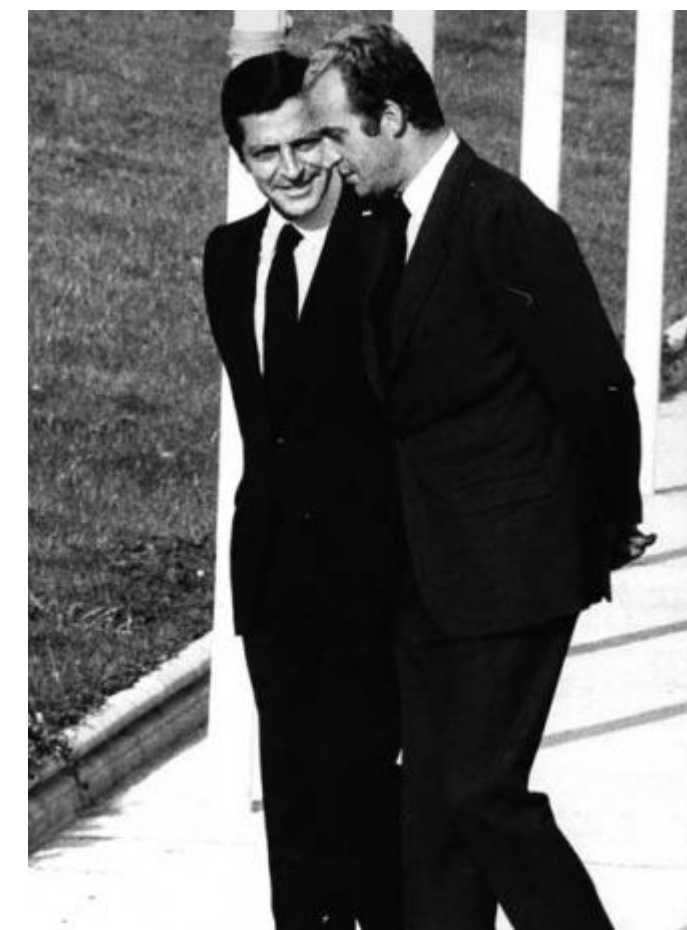
Adolfo Suárez et Juan Carlos