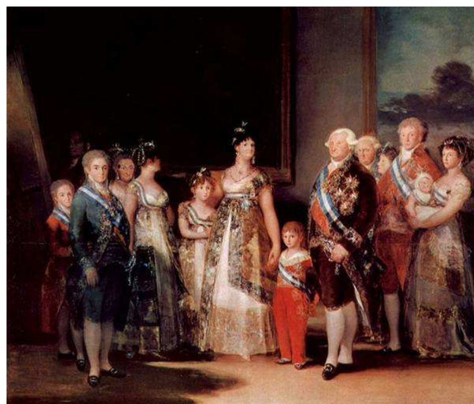
La famille de Charles IV Goya